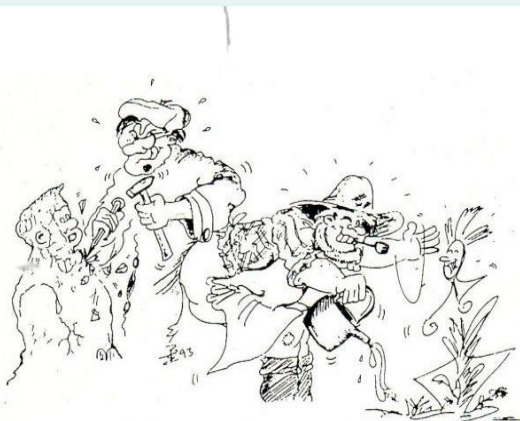
Pädagoge als Architekt / Bildhauer Pädagoge als Gärtner